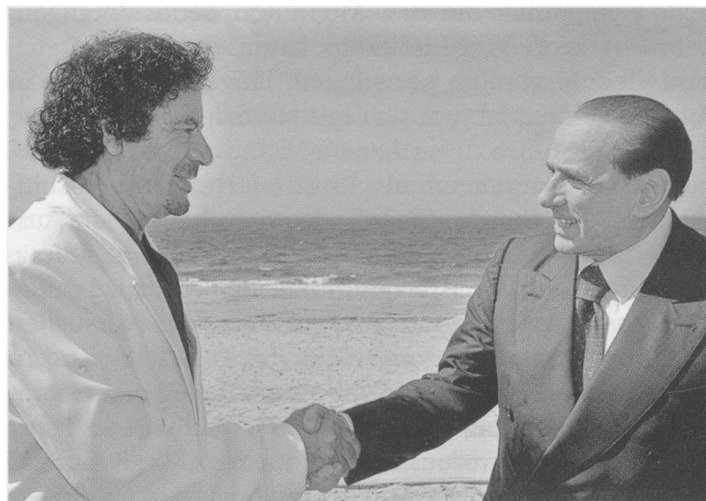
Der Beginn einer wunderbaren Freundschaft? Der italienische Ministerpräsident Silvio Berlusconi mit dem libyschen Staatschef Muammar Gaddafi, im Juni 2008 Aus Edition Le Monde diplomatique, 4/2008